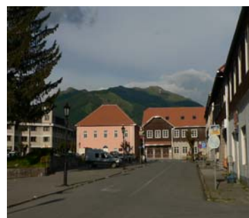
Projektna kancelarija u Kolašinu